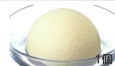
バニラアイス 1個 写真はイメージです。