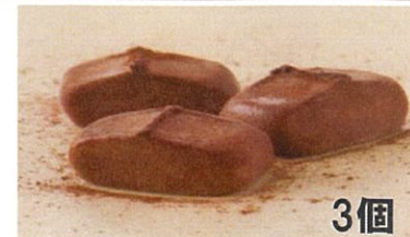
アイス生チョコ 3個