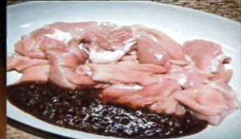
旨辛やみつき上ミノ ¥780