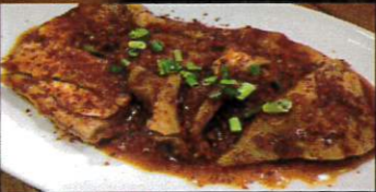
ピリ辛なんこつカルビ ¥780