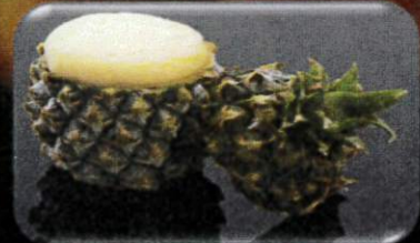
ミニパインホールシャーベット