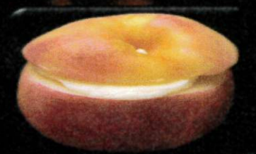
桃ホールシャーベット