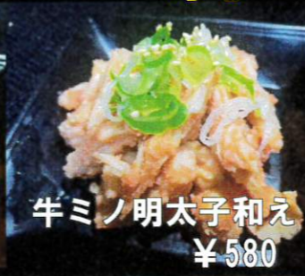
牛ミノ明太子和え ¥580