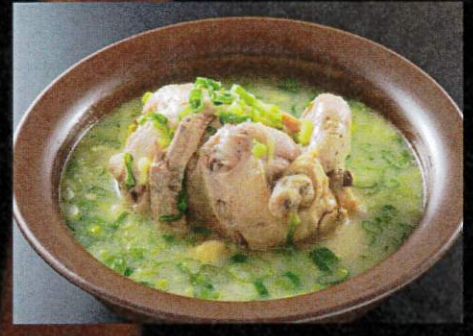
サムゲタン ハーフ ¥1,080 丸一匹 ¥1,900