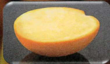
オレンジシャーベット