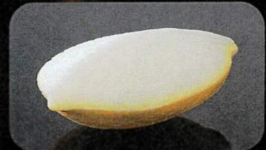
レモンシャーベット