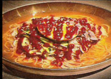
冷 麺 ¥1,080