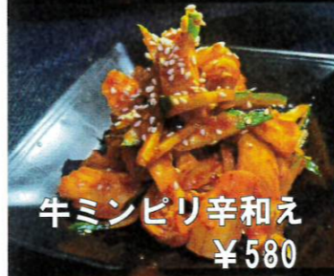
牛ミンピリ辛和え ¥580